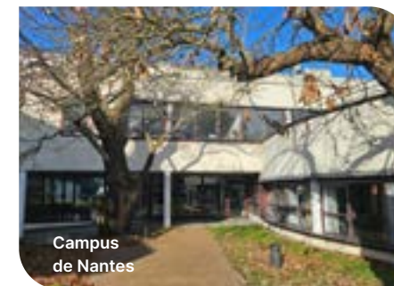
Campus de Nantes