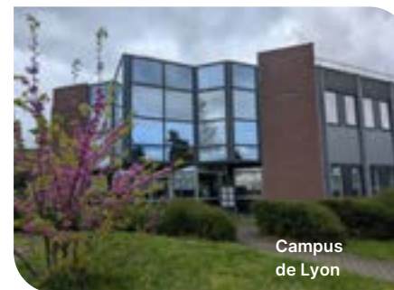
Campus de Lyon