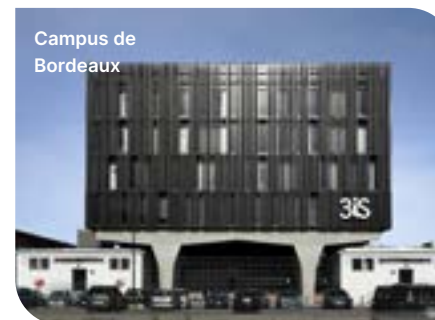
Campus de Bordeaux